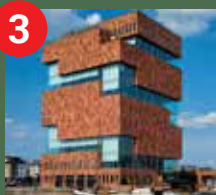
MAS Musée sur la rivière