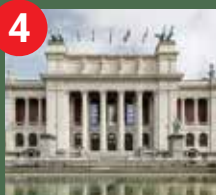
KMSKA Musée Royal des Beaux-Arts d'Anvers