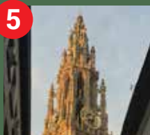
Kathedrale Unserer Lieben Frau

...oder wählen Sie selbst Ihre fünf Ikonen und wir sorgen für die perfekte Route!